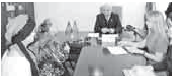
Депутат Государственной Думы Зур Геккиев провёл приём граждан в рамках недели приёмов, приуроченной к 16-й годовщине образования партии «Единая Россия»...

В ходе приёма было рассмотрено 12 обращений по вопросам трудоустройства, оформления земельных участков, трудовых пенсий, капитального ремонта, лекарственного обеспечения.