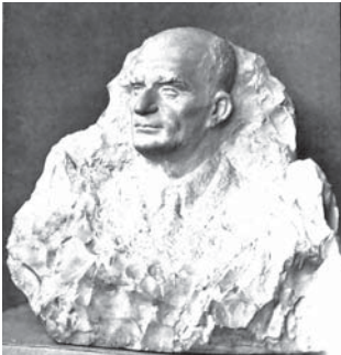
Портрет Саида Шахмурзаева

До конца жизни Хамзат Баксанкулович оставался очень востребованным художником. Ему удалось реализовать множество своих авторских задумок. Он получил официальное признание: удостоен почётного звания «Заслуженный художник РСФСР», получил Государственную премию КБАССР. Его высоко ценили коллеги, он был уважаем всем художественным сообществом. Произведения Х. Крымшамхалова хранятся в престижных музеях многих регионов России, Прибалтики, Казахстана.