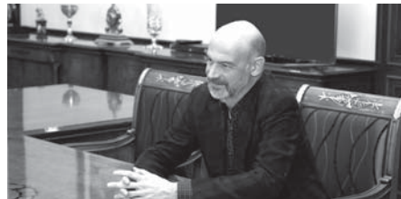
М. ЯРОСЛАВСКАЯ.

Ю.А. Кокков назвал фильм А.П. Ланге бесспорным творческим достижением и высказался за реализацию ряда образовательных программ.