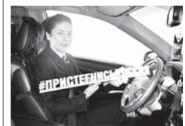
Со старшеклассниками лица для одаренных детей детской академии творчества «Солнечный город»...