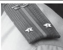
во-исполнительной системы, и их семей. Военным пенсионерам страховая пенсия по старости назначается без фиксированной выплаты.

Военные пенсионеры могут претендовать на вторую пенсию по выслуге лет или по инвалидности от Министерства обороны Российской Федерации, МВД, ФСБ и ряда других силовых ведомств.