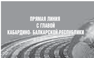
ПРЯМАЯ ЛИНИЯ С ГЛАВОЙ КАБАРДИНО-БАЛКАРСКОЙ РЕСПУБЛИКИ