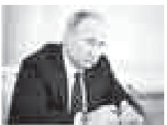
доходной налоговой базы регионов как основы экономического роста. Владимир Путин назвал Кабардино-Балкарию в числе десяти лучших субъектов России,

Обсуждены предложения в сфере улучшения инвестиционного климата. Отдельным блоком рассмотрены результаты внедрения целевых моделей упрощения процедур ведения бизнеса, формирования удобных, комфортных условий для запуска новых производств, создания дополнительных рабочих мест, повышения реальных зарплат и доходов граждан. Говоря о необходимости укрепления