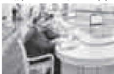
Подчеркнул: в работе по улучшению делового климата не должно быть никакой исключительности. Перед всеми – и федеральными, и региональными, и муниципальными структурами – стоит общая задача по привлечению инвести-

где зафиксирован сорокапроцентный рост инвестиций в основной капитал в реальном выражении. «Уже сложилась группа регионов-лидеров, я уже говорил об этом, которые задают высокие стандарты в инвестиционной сфере.