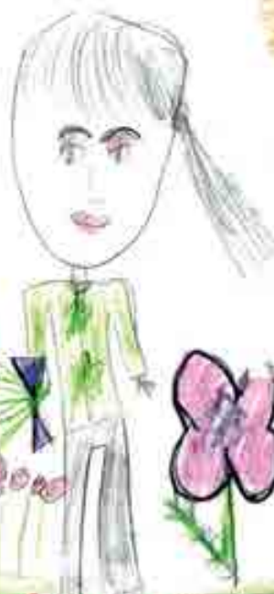
Аппайланы Мариям, 1-чи классны окъуучусу