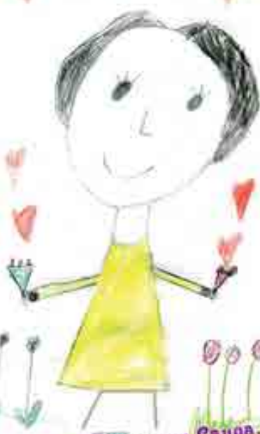
Сарыбашланы Сауда, 1-чи классны окъуучусу