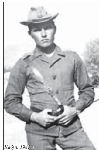
Кабул, 1983 г.

Вновь над Кабулом маршево встает, А на Соланге, где рукой до Бога, Колоны пробиваются вперед И смерть меж скал плутает, как дорога. В Панджшере «перманентные» бои – Такие, что в полете пули тают! За что там наши парни погибают? Не знаю. Нас просили – мы пришли. Как дико воем на луну Наш ротный пест по кличке Дембель... А мы – наивные, как дети – Пришли сюда, чтоб победить войну.