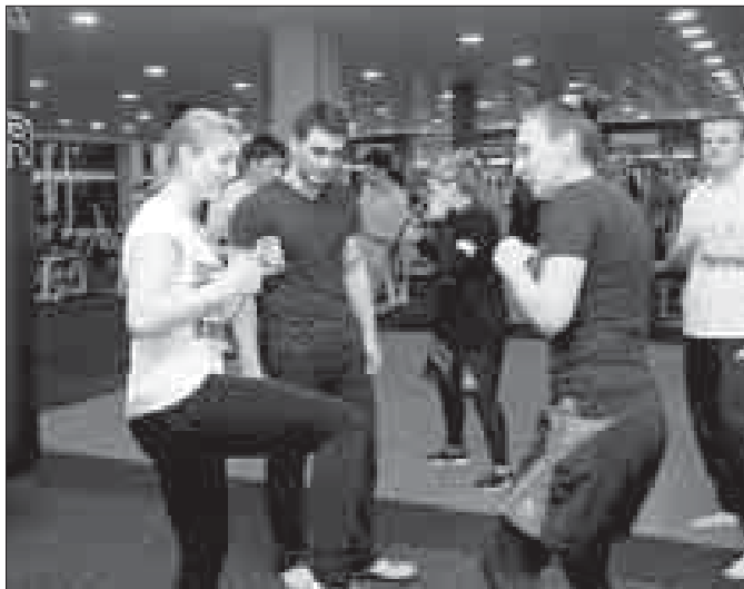
Видео в Instagram @sovetskaya_molodezh.