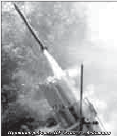
Противоградовая ПУ Элиа-2 в действии

В 1993 году Правительство Российской Федерации приняло постановление «О создании противоледяной службы» при Росгидромете.