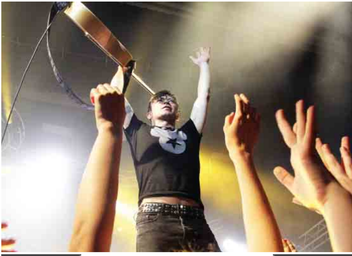
Фото и текст: Татьяна Свириденко.

рок-концерты проходят именно так – зрители должны танцевать, петь, свистеть, но не смиренно сидеть в кресле. Финальной нотой концерта стало исполнение на бис еще нескольких хитов.