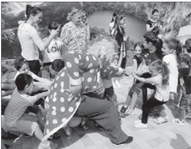
Видео на Instagram и в YouTube.