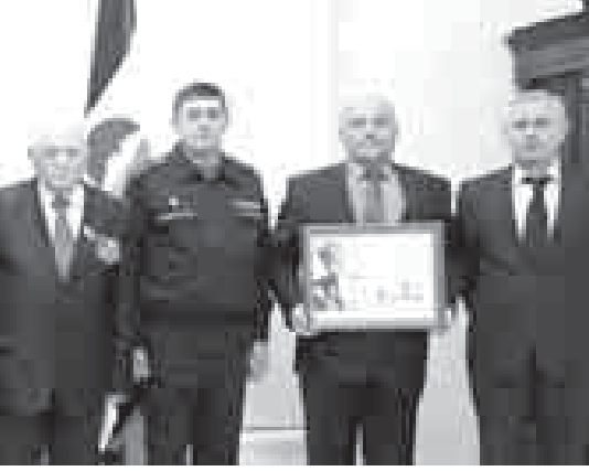
Ахыры 2-чи бетдеди.

алай алмай къалгъаныны юсюнден а 2016 жылда июнь айда белгили болганды. Аны юсюнден шартла «Российская газета» «Хорланмы жуудулары» деген излеу базасында табылгандыла. Орденни Къабарты-Малкъарны халкъына беруино юсюнден онуну уа жигитни жууукълары этгенди.