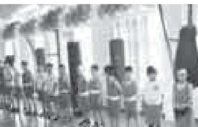
Программаны жашауда бардырыгъа 23 миллион сомдан артык бёлонггенди. Дагъыда 2 миллиондан асламны регион бюджет бергенди. Бу ахча толусулай керекли ишлеге къаратылганды. Аны хайырындан

17 январьда регионла бла бирге видеосектор анал бла кенгеш бардырылганды. Анда «Эл школлада спорт залланы жаңуртуу» партия башламчылыгын 2016-2017 жыллада жашауда бардырыу» деген тема сюзюлгенди.