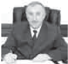
легенди. Къырал саугъала бла да белгиленгенди.

Залийханланы Хажи-Омарны жашы Къаншаубий 1961 жылда 16 июньда КъМАССР-ни Чегем районуну Янкой элинде тууганды. Къабарты-Малкъар къырал университетни бошганды. 1994 жылдан башлап ич ишлени органларында тюрлю-тюрлю къуллукълада иш-