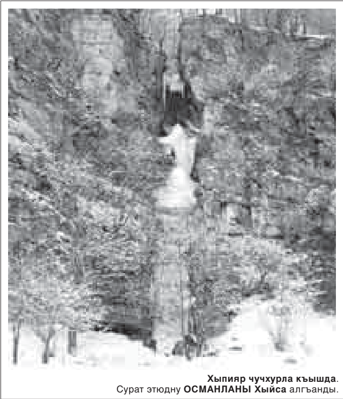
Хыпийр чучхурла кышда. Сурат этюдну ОСМАНЛАНЫ Хыйса алганды.