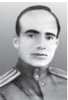
Сакала, ариуум, сакала, ариуум, Биз бирге жашау этербиз. Белке жылыны жашуу этерча, Улуу шаарга кетербиз.