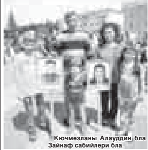
Кючмезланы Алаудинн бла Зайнаф сабийлери бла.

БАЙТУГЪАНЛАНЫ ИСАМАЙ. Сурат авторундула.