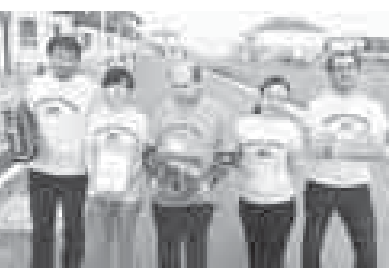
кыуаныч этебиз», - деп кыошканды ол.

Сокурланы битеурсей общественларыны (ВОС) Шендюголу интеллектуал искусствону кубугунда («КИИ») КМР-ни Жамуат палатасында Жаш тельо советни активистлери ючюнчю жерни алгандыла, деп билдиргендиле махемени пресс-службасында. Кубок Махачкылада «Дельфин» солуу базанда бардырылгыды. Аны мурагы чекленген онлары болгун адамлагыа айнырча онгла тапдыруу эм жамаутада ала ны юслеринден ахшы оюму кырау эди. Эришюге кыралыны талай регионундан - Адыгей, Кырым, Кавказий-Черкес, Кыабарты-Малквар, Север Осетия-Алания, Чечен, Ульяновск эм Астрахань областы, Краснодар край, Дагыстан - онеки команда кыатышканды.