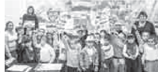
«Мени тегерегимдеги табийгъат», «Мен табийгъат тазалыкыда саклауу ючюн кыол көтөрөм» деген эришюле бла сурат ишюу конурола да болгундыла. Жюзге жуук жашчыкык бла кыаччык аланы хар бирине да тири кыошулгандыла. Ахырында хорлаганлагыа грамотала бла саугала берилгенди.

Кеп болмай Тегерекдеги кыдуурети саклауу битеудуния ючюнчю жоралал, КМР-ни Бийик тау заповеднигде «Экология эм биз» деген акция бардырылганды. Биогонлюке байрам адам улу табийгъатны тазалыкыда саклауу эмда сауулай Тегерекде болумгыа эс бурруна магынаны тутды.