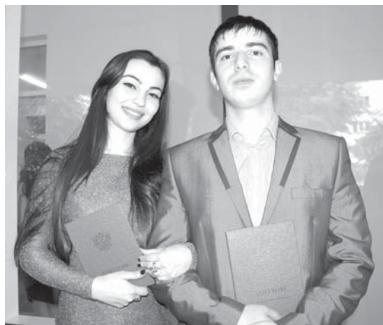
Ксаналаны Ислам бла Мисирланы Индира.