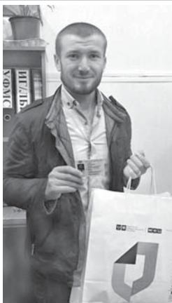
адамлага да ишлерин толтурурга тынчырак боллуккыду, деп бирдиргенди араны пресс-службасындан.

Бу кырал жумуш эм көп суралганладан бириди. Аны МФЦ-лада толтурурга амал чыккыганы уа тамамлаууна качествен сун ёсдюрюлкюду,