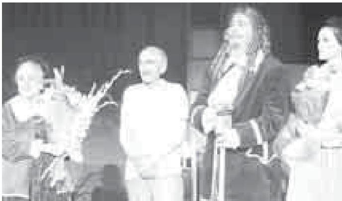
«Тартюф» спектакли премьерасындан сора (2015 ж.)

Белгилерге керекди, ара шахарда жашауу энчилиги Мажитни кез кьарамларын тюрлендиралмагьандыла: ол, алгыныча, миллет культурасына кертичилей, халкьына табынганлай кьалгьанды. Аны жюрегинде жашагьан Малкьарга сиймеклиги уа кюнден-кюнге бютюн кючлене, жангы кьарыу ала баргьанды. Ол кеп-