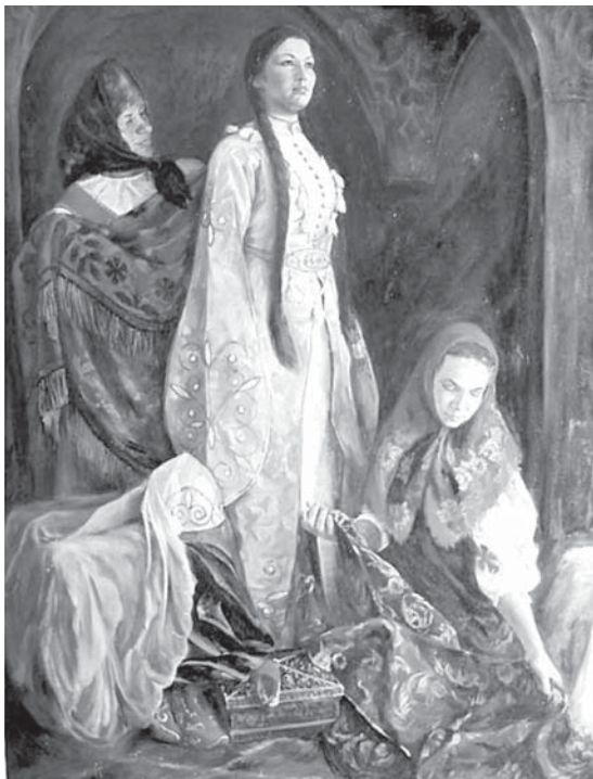
Вобленко Д. «Иван Грозныйни черкес бийчеси» (2007 жыл).

уллу хата салгъандыла. Аны бла бирге уа бийле бир бирлери бла кюрешлерин тохтатмай, регионну андан да къарысуз этгендиле. Быллай болумда уа Шимал Кавказны халкълары, ол санда адыгла да, къарылуу къыралдан болушлукъ излей, Россей бла жууукълашыргъа кюрешедиле.