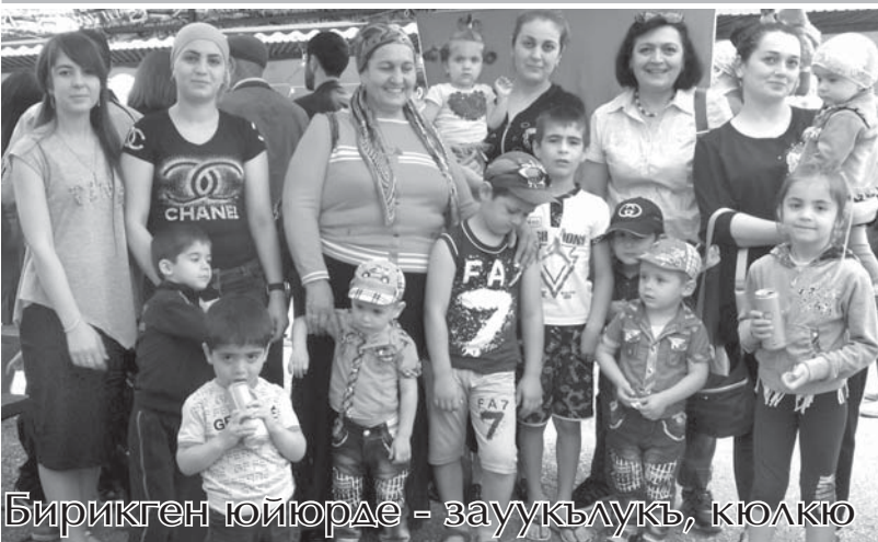
Бирикген юйорде - зауукълукъ, кюлкю