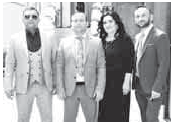
Кыарындашлары эм эгечи бла.