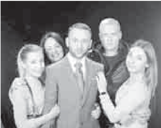
Алан коллегалары бла.

- Кыаршыларым хар тюбегенден бередила бу соруюну. Мен да хар жолдан тыосюз, керекди деп жууаплайма. Оюн болсада, кесим да анылайма кереклисин ол жумушун. Алай кыадар бюргян күннге дери биреу да амал этала болмаз анга. Иш - ишди,