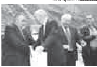
Эзданлы Альберт Тетуаны Хадиси саугьалады.

арьган да болур эдиле, алай эсертме хунага жуукьлашханыларында уа, ала тире болду. Мында уа алгага ани башчысы Гемуланы Акуб бля бу ауудан чькьган жаш, бөлүм актер Балыналаны Зарьф айранда толг голпан бля тобедиле.