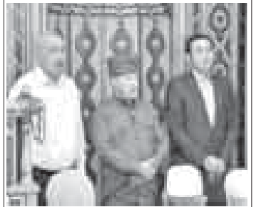
Ууу бла шагъарей этгенди.