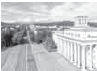
КъМР-ни Башчысыны бла Правительствосуну пресс-службасы.