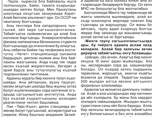
Абдулах, тьрели соруу: гьлациологияны сайларгьа сизни не зат кьелдендиреги?»

«Кьайда да, не да мардыса бля болса, ажай да, игиди. Бьсагьатда Тьрнеуьзда ьрхы келгенди. Ол а кьеп коньлени ичинде кьызыулукь кьысханьны хатагьанданды. Бьлемисиз, башлары ачык чьрандан сора да, тьпелери жабылп тургьанла бардыла. Алада уа кьар, буз да исиде эрип жьыйлады. Сора, бу болгьаныча, ьзы бля кьаты жаунала жьсаула, суу ьзыгьыры, ташны да кьобьра барды. Алай бля ьрхы келирге кьоркьук чьгьады.