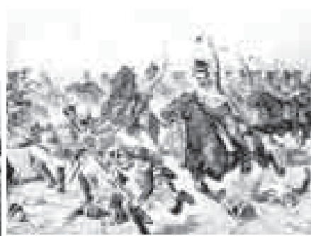
чыныгылулугу, махтаулулугу эмда батырлыгыны белгисиди. Россейни сийген эмда анга кертичи болган хар адамны да аны махтаулу озган жигитлик заманлары ючюн ёхтемлиги эмда келир заманы алапат боллугуна ийануу да ма аны бла байламлыдыла.