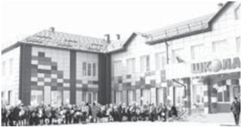
Черек районну Огъары Жемтала элинде - жангы школ.