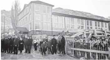
Огъары Малккарда физкультура-саулуккуну кючлендириу комплексни кзуанчлы ачылуу.