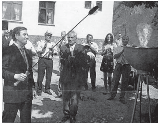
Бызынгыда кёксюл от жанды. Алай бла Къабарты-Малкыарны шахарларына бла эллерине газ тартуу ахырына жетдирилди. 2005 ж.