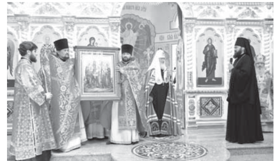
Мария Магдалинаны соборуну ачылуу.