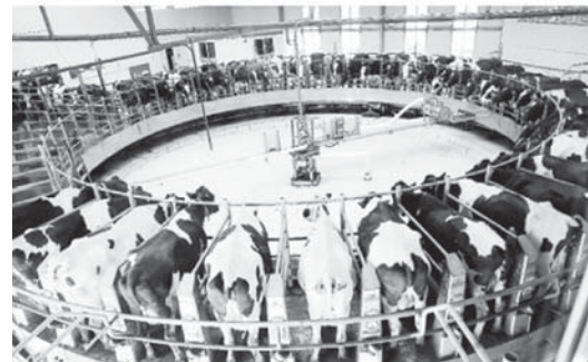
«Агро-союз» малчы комплекс.