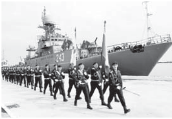
Къабарты-Малкыар атлы кеме.