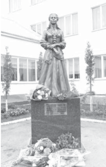
Орус устазыа эсертме.