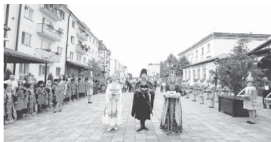
Къабарты орам - Арбат.