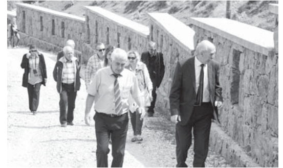
«Къайсыннга жюз атлам» мемориал комплекс.