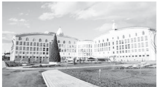
«Кюю шахар» сабий академия.