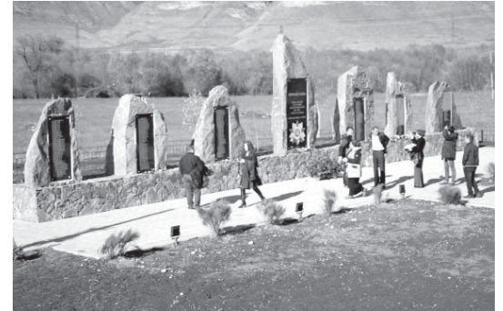
Халккы бирлигини кюнюнде Кёндеде Улуу Ата журт урушдан сора мамыр жылда суушхан ветеранланы хурметлерине мемориал комплекс ачылганды.