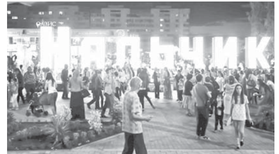
«Оазис» сатыу-алыу араны аллында фонтанла. Шахарчыла салурга сыйген жер.