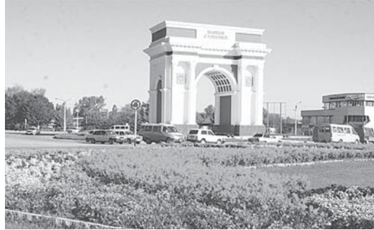
«Емюрге Россей бла бирге» арка.