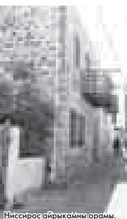
Ниссирос айрыкамны орам.

Эбона элде бизни бир сейрилик этнография музейге элген эдиле. Анда уа кызмачла сокъган бизни таутыды, от жагабыз, агачдан, топуракдан этилген ой керекле.