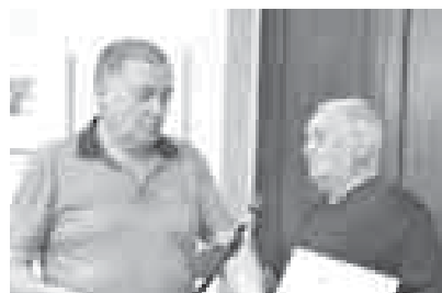
Парижден ырызлыкъларын билдире жиберилген кыагытыны окугъанды.

Бу кинолде Культура фонда «Мария - русская царица из Кабарды» деген документли фильмин презентациясы болганды.