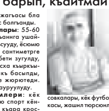
Совкалары, кёк футболчы, жашин тюрсюлю

ёрге жан, сары спорт курткасы. Алюев Руслан Сафарбичини кюйда болганыны юсюнен бир торлю шартланы биле эсегиз, бу телефону номерле белеширинизни тилейбиз: (86632) 4-10-02 (дежурный бөлүм), 8-967-421-00-28, 02 недю полицияны жуукъудагы бөлюмюне.