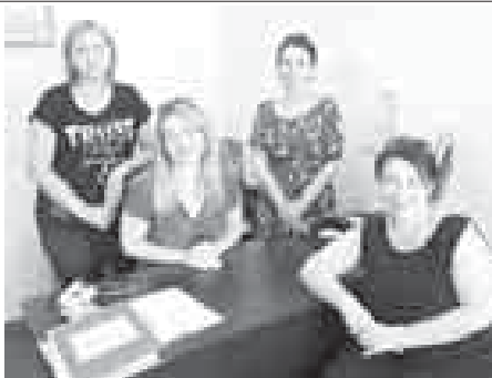
Аланы асламысы сабий туугъанда эмда анга кырагъан заманда тѐленген аханчы алырча излегенди. Быйыл ара себеплик этип республиканы «Радуга» саулукъга багъуу эм реабилитацияны арасында кѳп сабийли эм кылайсыз юйоруден 65 гитче солгъуанды. Дагъыда жай каникулда 59 сабий башха солуу базалада кечингенди. Службада учѳда опекуллары кырагъан акъылбалыкъ болгъан 28 сакъат турады. Аланы жашау болумлары да тинтилгенди. Уруну, иш бла жалчыту эмда социальный къоруулау араны таматасы Мирзоланы Закират айтханга кѳре, службаны ишине чырмау салыра зат жокъду, профильли министерство да болушлукъ, биогонюкде ала борчлары тамамладыла. Анатолій ТЕМИРОВ. СУРАТДА: Уруну, иш бла жалчыту эмда социальный къоруулау араны специалисте.

«Урунуу ветераны», бирине уа «Улуу Ата журт уруну ветераны» болгъанларына шагъатлыкъ кыгъыла берилгенди. КъМР-ни сыйлы саугъаларына тиийши болгъан 73 адамгъа ай сайын ача теленирча завлениларына кыралгъанды. Бѐломуе учѳда Чернобыль АЭС-де радиациондан ачыгъан 48 адам барды. Аладан 39-суна тѐлеуле этиледи. Андан сора да, ай сайын азызъкъ алырча ача тѐленеди. Жыл сайын саулукъларына бакъдырыча онг тапдырылады. Озгъан кезуеге радиациондан ачыгъанларына 79 адам завленине бергенди. Бир жол тѐленген социал пособие алырча 49 завленине берилгенди. Оналты адамгъа кырал социальный стипендия алырча справка берилгенди. 250 адам жашау журт субсидияны алырча завленине жазгъандыла. Биогонюкде аны 1537 адам алганды. Саулай да анга деп 4 186 76 сом тѐленгенди. Орта эеп бла алгъанда, субсидияны ѳлчѳми 2 689 сом болгъанды. Ююру политика эм уруну жаны бла байламлы бѐлум быйыл тогуз жюз завленигъа кырагъанды.