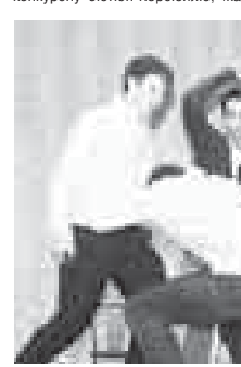
рыкъ этген эди. «Оливье Ганьян» къауумну келечилери уа биринчи «Большые гоки» деген берюну бек сюенгендеринден сайлагъанларын айтхандыла. Аллай сейир, кырауучулары бириктирген, чам халда бардырылгъан эришуле унутулмагъ-

ны оюнлары уа кѳбюсюнде къабартылганы бла малкъарлыланы жашаулары, тѳрелери бла байламлы болгъанды. Анга кырауучула бютюнда къууангаларын белгилерге тиийшиди. Дагъыда «Ночь - голубая ночь», «Оливье Ганьян», «Чайка обыкновенная», «Не дать, не взять» деген къауумла да къууандыргъандыла. Аланы хар бирини да чамлары бир энци болумгъа жоралангъанлары уа конкурсу бютюн тюрсюнюю, жа-