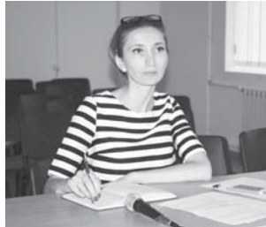
Кенгешле бардырып, тюрлю-тюрлю темаланы сюзерге келишгендиле.

Кенгешде бирлешген диссертация советлени къурауны, tintiu ишлени бардырыуны эмда башха вопрослары юслеринден да сѳлешгендиле. Хар айдан тюзюнлей