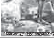
Минги тауда туристлени кьаууму.

Россеиден, тыш кьыралладан келгенлени солурлары кёп жылы Элбрусун туризмден бла эскурсияладан совети кьураганды. Ол, турист фирмала бла келмишле таусандан тышында, адмала мында заманларын заукулу, хайырлы ётдюорлорлерине, андан сора