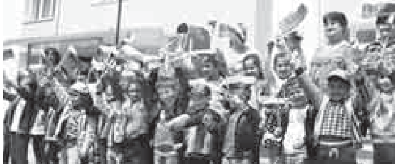
КЪМР-ни Башчысыны бла Правительствоосуну пресс-службасы.