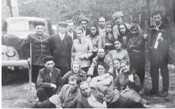
Школну 60-чы жыллада коллективи.