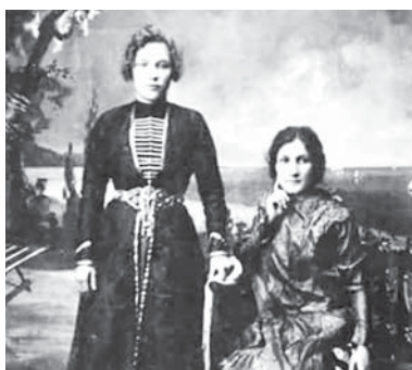
Олтурган Гелюстанланы Шамалини кызы Шихидат орусла устал бля.

Ахёбекланы Анатолийни, Мызыланы Къаншаубийни, Бечелланы Илиясны, Беппайланы Мугалифни, Гелюкланы Абдуллахны, Кудайланы