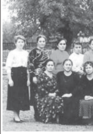
Школну 90-чы жыллада коллективи.

Ма бу сиз суратда кёрген тишюруладан бир (олтурган) бу элини кыраган Гелюстанланы Шамалини кызы Шихидатды. Бирси уа школгъа жиберилген биринчи орусла усталды. Жарысууга, биюнюнде аны эли, тукуму да белгисиздиле. Бу суратта ол Шихидатны миллет кийимлерин кийип тошгенди.