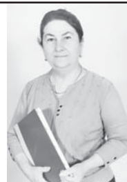
Дерслеге билмей тургъанлыккъа келуучу эди. Кыаты суратганды бизден. Алай эсе да, ишни жашырынлыкларына да юйретгенди. «Сабийлени кесинге тынгылат билмесенг», ала сени бир заманда да аныгларлык туйюлюнде. Эм алгъа ол жоруккъа эсе бур – деп юйретгенди. Андан бери да унутмайла аны айтханларны, дейди ол ушагызыны андан ары бардыра.

ге ги юйренирикдиле, арда окуугъа да къыйналай кирликдиле деген акъылда. Болсада гитчеле кюндюз анда тургъанлыккъа, ингирде юйре келгендиле.