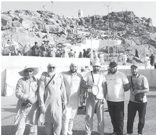
Арафа кыяны тийресинде.

Алай, бизни ушак нёгерлерибиз билдиргенлерица, арт жылда бу кырал уллу кыуурушга ушайды. Муслиманла ариу болумлада жашар, тэрелени толтурганда чырмаула болмаз ючюн кыолдан келген этиледиле. «Аллахны ахшылыгындан, Аль-Харам межгит кенгертилгенди, аны тегерегинде жангы кыонак юйле ишленгендиле. Бу жумушлага кыйын