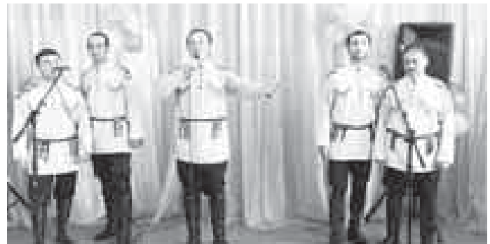
«Ийнар» жыр кыауум.