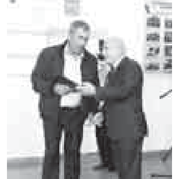
Мухадин Афаунов Цаколаны Тахирни саугалайды.

ТЕМУККУЛАНЫ Аминат. Суратла авторнудула.