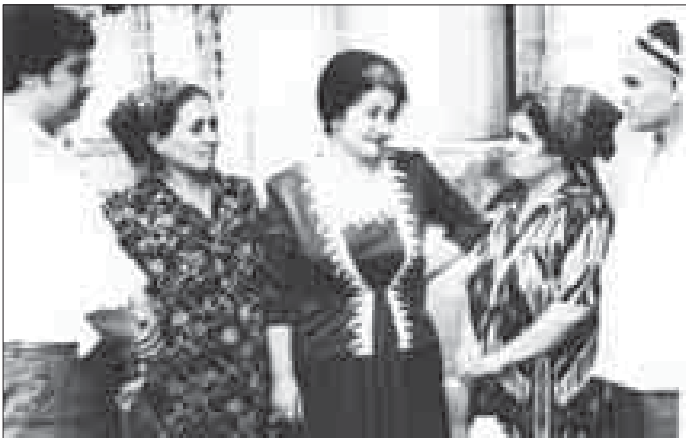
Отуз юч жылдан сора кьумач ськьган комбинатда тюбешуу.