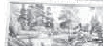
Хасета Маламусов бла Цаколаны Жамиля.