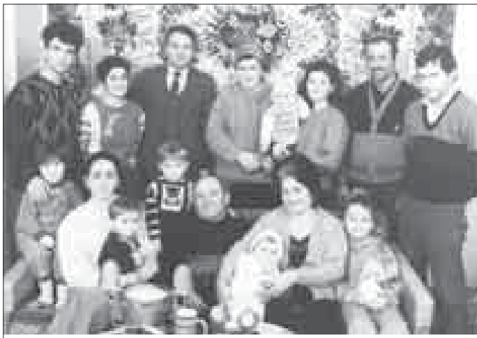
Мени юйюрюм - мени байлыгым.