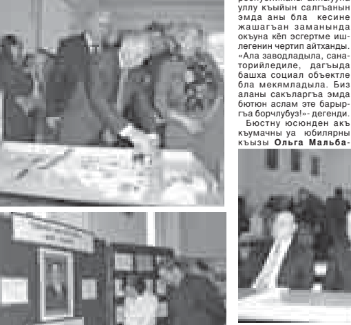
вет, кырал эмда партия кыулуукчуну уллу бюстун ачханды эмда суратла чыгарылган конфертын презентациясында