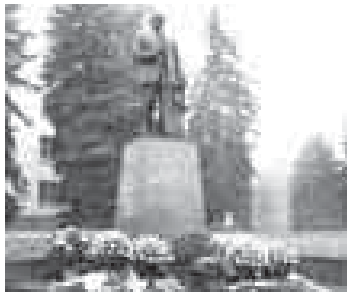
эм дин организациаланы келчилери да бар эдиле.

18 ноябрде белгили къырал къуллакъчы, КПСС-ни Къабарты-Малкъар обкомуну биринчи секретары Тимбора Мальбахова 100 жыл толукъ эди. Шабат кюн, суукъ болганына да къарамай, бу белгили политикге, республикага кѳл къалмай 30 жылы ичинде башчылыкъ этген адамга хурмет этерге КъМР-ни Правительствоосуно юкюню къатында ага салынган