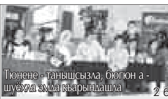
Тонене - танышсызла, бюгюн а - шухъа эмда къарындашла 2 бет