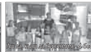
Аш да, къаш да бергендиге 4 бет