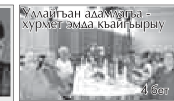
Умайгъан адамлага - хурмет эмда къайгырыу 4 бет