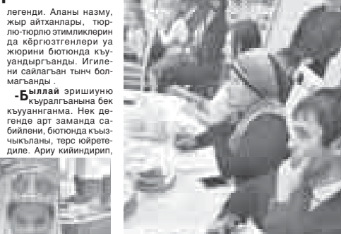
да келюн жарытханды.

ахыр эришуде биришер жин бишириге керек эди. Алгъа Россейни Куйнарларыны ассоциациясы келечиси шеф повар Чеченланы Бисо сойюп болушханды. Къызчыкъланы усталыкларын, итимулерин да жюри энчи белги-