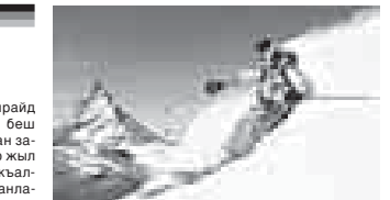
Быйыл октябрьде Турстан аналитикалы агентство жарашдырганды. mailto:glava@kbr.ru

Къабарты-Малкарны курортлары къыралы кепле суйюк келген он тау-лыжа курортну санына кеп кере киргендиле. Аллай рейтингни