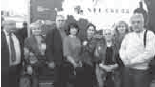
Къабарты-Малкардан съезде къатышханыла къаууму.