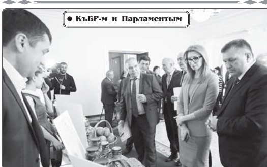
КЪБР-М и Парламентым

КЪБР-М и Иштэным Правительством я пресс-Луэкукыуапщэ.