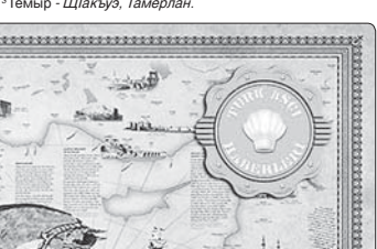
Саракис, Чарисе - тхьэитлим уржэллэ; 2*Хьатуэуик - адыгъ лпкъуэуэи ныщщ зы; 2*Мыыр - Шпакъуэ, Ташерлан.