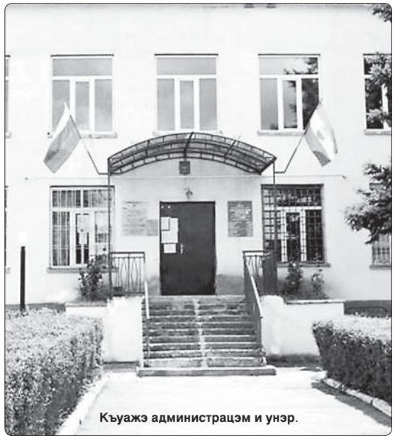
Кьуажэ администрацэм и унэр.