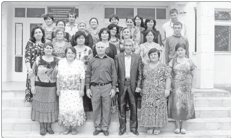
ШЦЭНЫГЭЭМ, ЕПХА ЯПЭ ЛЭЖЫГЭЭХЭР, КЪЭБЭРДЕЙМ ШЕКЛЭГКЛАР, XIX ЛЭШЦЫГЭУЭМ И КЛЭ XX И ПЭ ЗЭМАНХЭРШ, 1898 - 1902 ГЭЭХЭМ КЪРИУБЫДЭУ КЪУАЖЭ ШКОЛУ ШЫНАЛЪЭМ 27-РЭ КЪЫШЦЫЗЭЛЭХЭУ ШЦЫТАШ, АБЫХЭМ ЯШЦЫЦ БОЛТЭЙ КЪЫШЦЫЗЭРАГЭЭПЭЩА ЯПЭ ПЭШЦЭДЭЭ ШКОЛРИ.