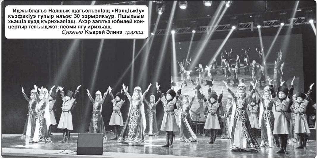
Иджыблагъэ Налшык шагъэлэпIащ «НалцIыкIу» къэфакIуэ гупыр илэс 30 зэрырикIуэр. Пшыхъым хъэщIэ куэд кърхъэллэщ. Ахэр зэплгъа юбилей кон-цертыр телъыджэт, псом ягу ирихъаш.