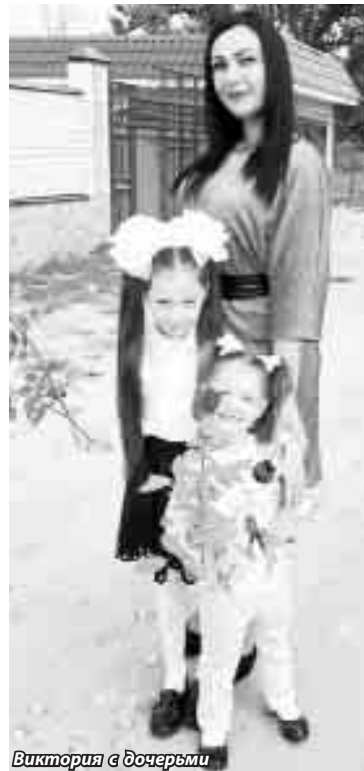
Виктория с дочерьми

Не считая крупных календарных мероприятий, в ДК ежемесячно проходят и тематические - конкурсы рисунков,