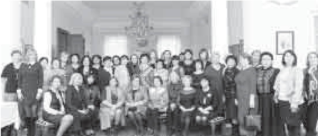
В Москве по приглашению Союза женщин России прошли обучающий семинар «Школа гражданской активности» представители женсоветов из 37 региональных отделений СЖР.

Основная тема, которой были посвящены занятия, - «Союз женщин России - Году добровольца в России. Формы, принципы и методы добровольчества советов женщин в поддержку семьи, родительства, детства».