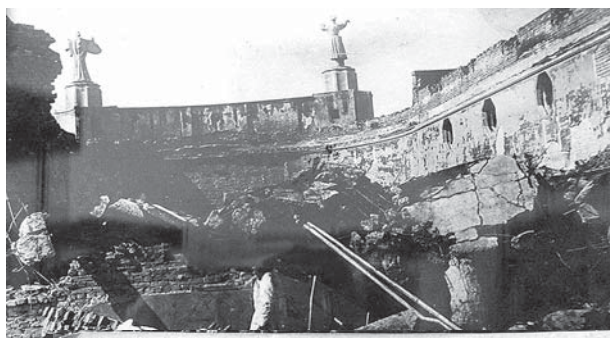
ВЗОРВАННОЕ ФАШИСТАМИ ЗДАНИЕ КИНОТЕАТРА НА УЛ. КАБАРДИНСКОЙ

при поддержке 910-го батальона румынской пехоты удалось полностью овладеть Нальчиком. Остатки советских войск были вынуждены отойти к северу Черекского ущелья по склонам Кизилово и через селение Хасанья по лесной дороге. 19 ноября 1942 года началось наступление советских войск Юго-Западного и Донского фронтов, которые 23 ноября соединились со Сталинградским, окружив огромную группировку противника. На Северном Кавказе наши войска успешно развивали наступление на Нальчикско-Орджоникидзевском направлении, в конце