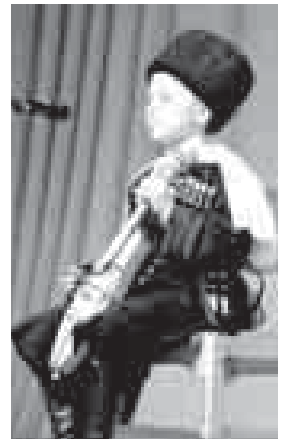
Черкесии, Краснодарского края, Дагестана и Адыгеи. Кабардино-Балкарию на фестивале представили танцоры из нескольких районов и столицы республики. Всего в фестивале участвовало

В нынешнем фестивале приняли участие детские хореографические ансамбли из соседних регионов. Многие приехали в Кабардино-Балкарию впервые.