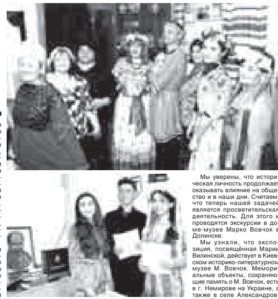
Мы уверены, что историческая личность продолжает оказывать влияние на общество и в наши дни. Считаем, что теперь нашей задачей является просветительская деятельность. Для этого и проводятся экскурсии в дом-музей Марко Вовчок в Долинске.