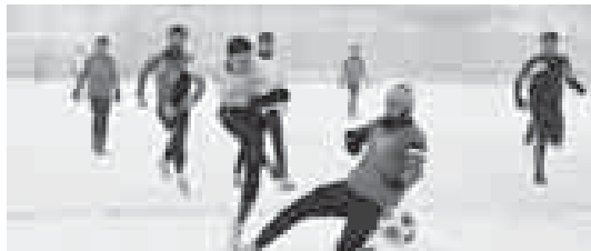
Открытый зимний чемпионат г.о. Нальчик, высший дивизион, положение команд после десятого тура