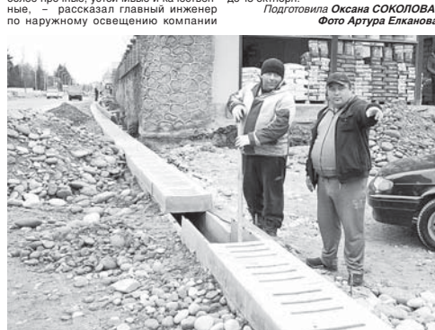
Подготовила Оксана СОКОЛОВА.

«Дизайн-К» Артур Тутов. За месяц мы установили 36 опор, а всего от улицы Калужного до улицы Толстого будет установлено 63 фонаря.