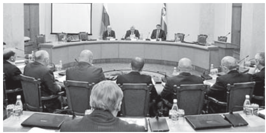
В Доме Правительства КБР состоялось заседание межведомственной рабочей группы по реализации Указа Президента РФ от 7 мая 2012 года №600 «О мерах по обеспечению граждан доступным и комфортным жильём и повышению качества жилищно-коммунальных услуг» под председательством заместителя Председателя Правительства КБР В.Х. Болотокова.

В заседании приняли участие государственные советники КБР Натби Бозиев, советник Главы КБР Аминат Унаева и члены межведомственной рабочей группы. Координатором реализации указа на территории республики является Министерство строительства, жилищно-коммунального и дорожного хозяйства КБР. Министр строительства, жилищно-коммунального и дорожного хозяйства КБР Б.Х. Кунжиев в рамках реализации мероприятия Указа Президента РФ от 7 мая 2012 года №600 «О мерах по обеспечению граждан доступным и комфортным жильём и повышению качества жилищно-коммунальных услуг» под председательством заместителя Председателя Правительства КБР В.Х. Болотокова.