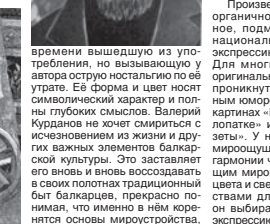
Гадание на бараньей лопатке. Х.м. 1992

В картинах живописца не найдешь изображения городской жизни, поскольку он прекрасно понимал, что город стирал национальные черты культуры этноса. Потому он выбирает село, где ещё сохраняются архитектурные детали культуры горцев и одновременно нарождается новое, заставляя вступать в диалог старинное и современное. Свой идеал художник нашёл среди традиций хангалеговского искусства, что есть в народе. Персонажи Валерия Курданова несут на себе явные следы традиционного образа жизни, заимствуют исключительно три вида деятельности, которые были извечно характерны для балкарцев: Они всегда одеты в национальную одежду, к тому