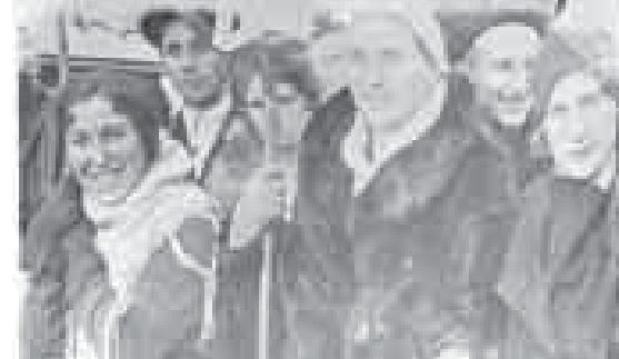
Группа участников субботника после посадки центральной аллеи в парке, г. Нальчик, 1923 г.