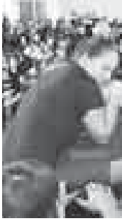
Привлечение молодежи к регулярным занятиям спортом и физкультурой: пропаганда здорового образа жизни; дальнейшая популяризация армрестлинга как

В соревнованиях по армрестлингу на кубок местного отделения партии «Единая Россия» г.о. Нальчик приняли участие почти полторы сотни школьников. Силу рук испытали представители восемнадцати учреждений образования.