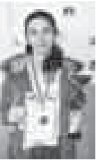
Материалы рубрики подготовки Альберт ДЫШКОВ и Владимир АНДРЕЕВ