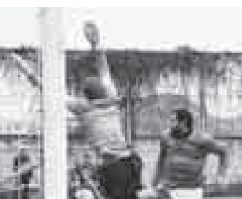
Материалы рубрики подготовки Альберт ДЫШКОВ и Владимир АНДРЕЕВ

После досрочного чемпионства «Школы №31-ГорИС-179», в заключительном туре Открытого зимнего чемпионата г.о. Нальчик среди команд высшей лиги перешивания оставались два вопроса: кто станет третьим призером и кто поднимет высшую лигу вслед за снявшейся в пятом туре «Звездой».