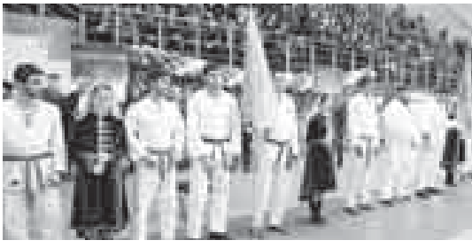
В Нальчике состоялось торжественное открытие турнира по рукопашному бою «Молодежь против терроризма», посвящённого памяти сотрудников органов внутренних дел, погибших при исполнении служебного долга.