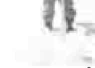
определение запасов снега в горах

По данным Росгидромета, в 1990–2000 гг. на территории России ежегодно фиксировалось 150–200 опасных гидрометеорологических явлений, нанесших ущерб. В последние годы их число возросло до 250–300 в год, а начиная с 2007 года в среднем один раз в два года число таких явлений превышало 400. При этом опасные явления, наблюдаемые в течение двух