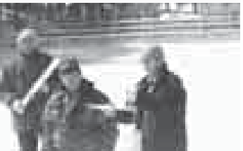
определение запасов снега в горах

Предупреждающая организация и населения об опасных гидрометеорологических явлениях в 2017 году в целом по стране составила 85 процентов. Экстренный эффект от использования гидрометеорологической информации в отраслях экономики Юга России составил 5431 млн. руб.