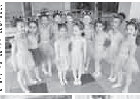
Доброй традицией стали праздничные концерты и интересная выставка, книги для которой предоставила Республиканская детская библиотека имени Бекмурза Пачева, а рисунки – Республиканская юношеская библиотека имени Кязима Мечиева, а также учащиеся детской школы искусств №1.