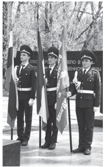
курсанты кадетской школы-интерната №1 с. Атажукино. На втором месте участники школы №13 Терка, замкнула первую тройку кадетская школа Терка.

Восемь команд-участниц выявляли сильнейших в четырёх видах: подтягивание на перекладине, беге на сто метров, стрельбе из пневматической винтовки, сборке и разборке автомата Калашникова. Победителями первенства стали